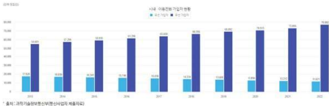
이동전화 가입자 현황

3GPP 규격 기반의 MCPTT(Mission Critical Push To Talk)는 5G 서비스의 확산과 더불어 북미 및 유럽 국가들을 중심으로 정부 중심의 재난 및 안전 관리를 위해 적극적으로 도입되고 있습니다. 모토로라, 에릭슨, 삼성전자 등의 글로벌 통신 장비업체들이 MCPTT 솔루션을 공급하고 있습니다. ReasearchandMarket 조사에 따르면 2021년 글로벌 시장 규모는 US$ 5,807.5 million이며 2028년에는 US$ 9,390 million에 달할 것으로 예상됩니다. 당사는 삼성전자와 긴밀히 협력하여 북미 통신사업자들에 게 지속적으로 관련 시스템들을 개발 및 공급하고 있습니다.