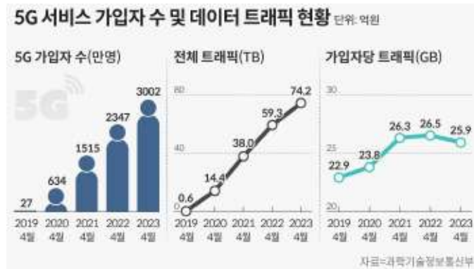
국내 5G 가입자 추이

전화 서비스는 여전히 중요한 매출 분야입니다. 가입자당 평균 매출(ARPU)이 높은 5G 무선 서비스 가입자는 꾸준히 증가하고 있습니다. 전체적인 유선전화 회선은 감소하고 있으나 KT의 경우 B2B 고객 대상 통신사업(Telco B2B)의 기업통화 매출은 성장하였습니다. 국내 Telco 기업통화 서비스와 무선 IMS 응용 서비스 시장에서는 외산 제품들을 대체할 수 있는 기술적 우위를 점하고 있어야 하며, 고객 요구 사항에 따라 소프트웨어를 커스터마이징 할 수 있는 개발 역량도 갖추고 있어야 합니다.